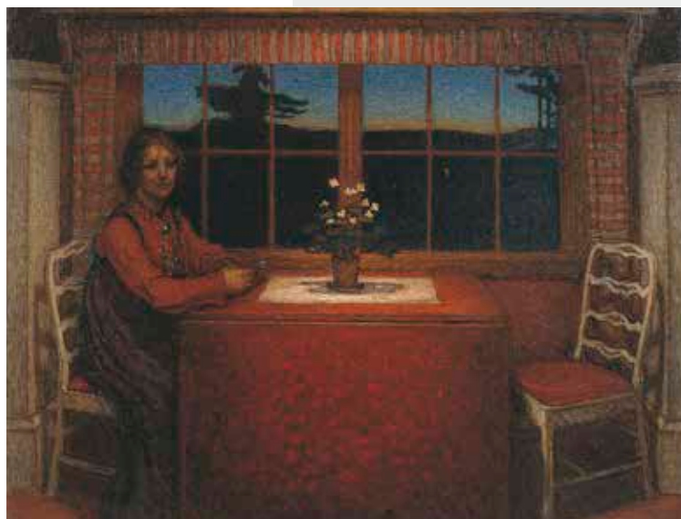
Björn Ahlgrenson "Vid fönstret" Olja 1905.