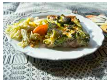
Pajer och mycket annat gott hittar du i caféet.

Våra råvaror är huvudsakligen ekologiska, fairtrade och gärna närproducerade. Vi serverar exempelvis rökta produkter och ostar från lokala värmlandsproducenter. Vårt mjöl kommer från Saltå kvarn och vårt ekologiska kaffe från Löfbergs Lila. Arbete pågår för fullt med att etablera samverkan med lokala småskaliga livsmedelsproducenter i Värmland. Genom detta ska vi kunna arrangera temadagar, provsmakningar och andra smakliga samarrangemang i framtiden. Vi erbjuder laktosfria, glutenfria och vegetariska alternativ.