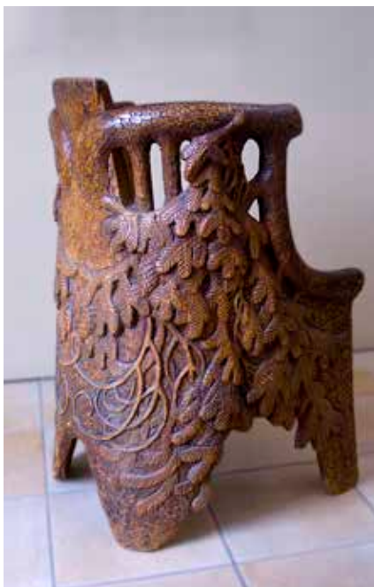
Gustaf Fjæstads stabbestol som var i rampljuset i TV4-programmet "Bytt är bytt" 22 oktober.

Museet gläds också åt att vi i samarbete med Curt skapat en serie om 12 unika Jössehärsstolar. De är målade i äggoljetempera i färgen "Jössehärsgrönt" med en slityta av linoljevax. Stolarna är numrerade och finns att köpa i museets butik. De vackra stolarna blir säkert eftertraktade samlarobjekt i framtiden. Först till kvarn gäller!