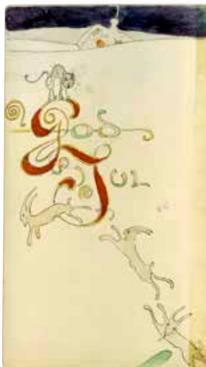
Julkort av Björn Ahlgrenson.