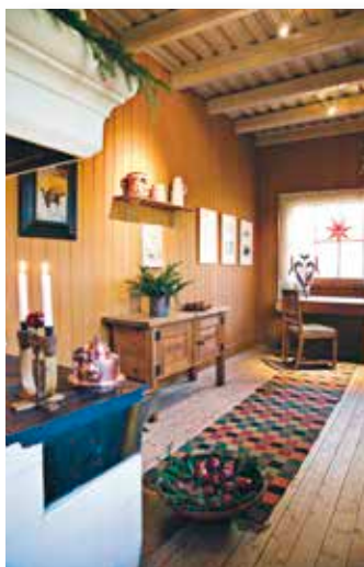
Julstämning i köket på Oppstuhage.