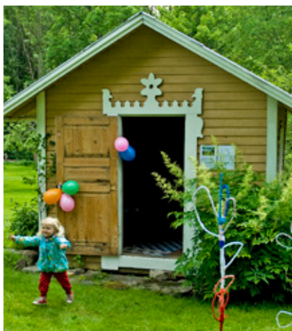
Full fart i Barnens ateljé på jubileumsdagen.