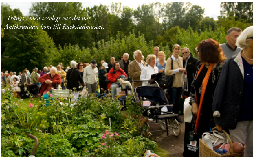
Trångt, men trevligt var det när Antikrundan kom till Rackstadsmuseet.