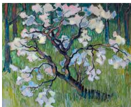
Signe Lund Strong "Äppelträd vid Oppstuhage".

Sommaren har följts av en ovanligt vacker höst med mildt väder som har bjudit på vackra färger i naturen, en härlig svamp- och bärperiod – och en innehållsrik tid på Rackstadsmuseet med flera uppskattade utställningar.