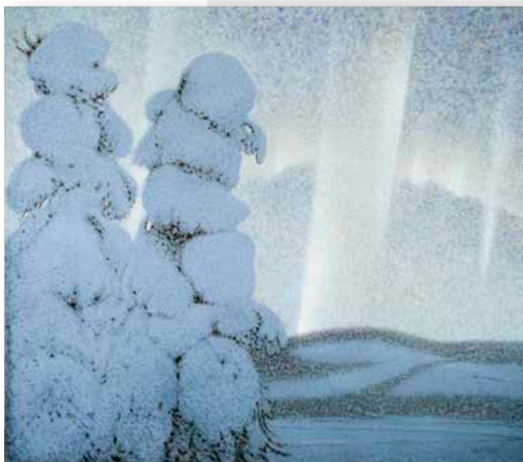
Bror Lindb "Norsken"