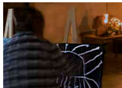
Spännande workshop med mörkermålning.

Projekt Olika Avtryck, som genomförs tillsammans med Ingesunds folkhögskola och Studieförbundet, genererar aktiviteter och utbildningar som minskar våra fördomar och erbjuder spännande mötesplatser för grupper i samhället som annars lätt ställs utanför skapande och kulturutbud. De återkommande workshops som genomförts på Rackstad museet inom ramen för projektet har varit efterfrågade och framgångsrika. Bilden nedan är från övning i mörkermåleri, därav bildens oskärpa!