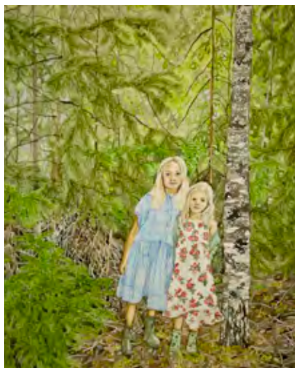
Akvarell av Jessica Stuart-Beck.

För andra året i rad kommer vi att be besökarna att fylla i vår besökarenkät. Ett gott värdskap och en aktuell och intressant verksamhet är viktiga för oss på museet. Enkäterna förra året visade att våra besökare är väldigt nöjda. Det var en övervägande del av besökarna som kom på grund av rekommendationer från släkt, vänner och bekanta.