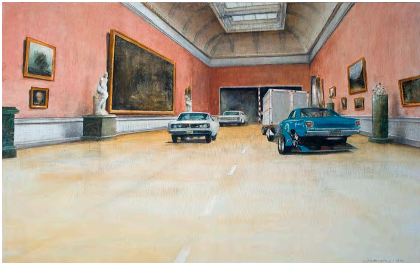
Sommarens utställning "Bilgalen" Ulf Wahlberg.

MEDLEMSBLAD FÖR IDEELLA FÖRENINGEN RACKSTADMUSEET • NR 1 2014 • PRIS 10:-