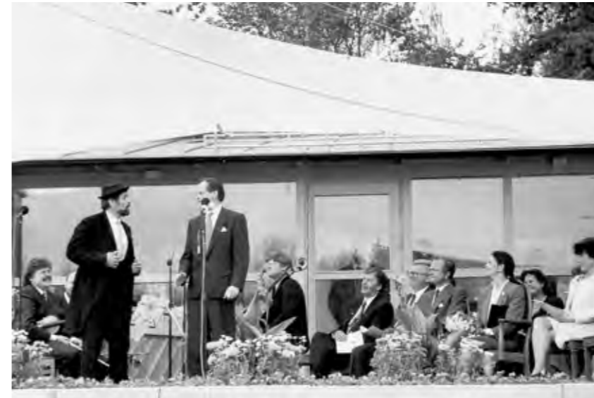
Elis i Tasere på väg att "hälsa på kongen"

ning fick vi också med Swedish Match som sponsorer med ett flerårigt driftstöd till det blivande museet.