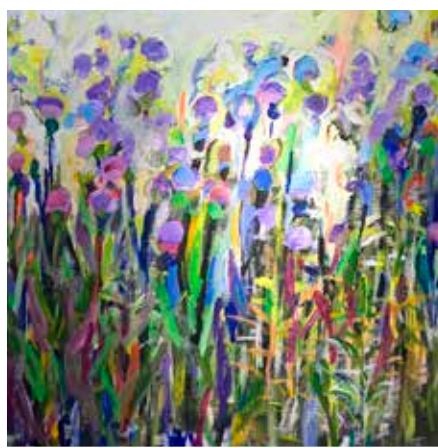
”Brudborstar” Gerd Görän